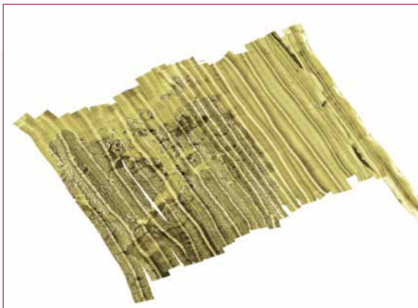
Fig. 4 - Mosaicaturatione dei sonogrammi con il Side Scan Sonar (immagine ripresa dalla copertina del IV numero) del 2013 di Archeomatica.

continuo del Bene, nella sua protezione contro le modifiche ambientali, nella sua difesa contro il saccheggio operato da organizzazioni criminali e, come detto, nella sua fruizione. I vantaggi di lavorare con uno sciame, rispetto al singolo robot sono i seguenti [5]: