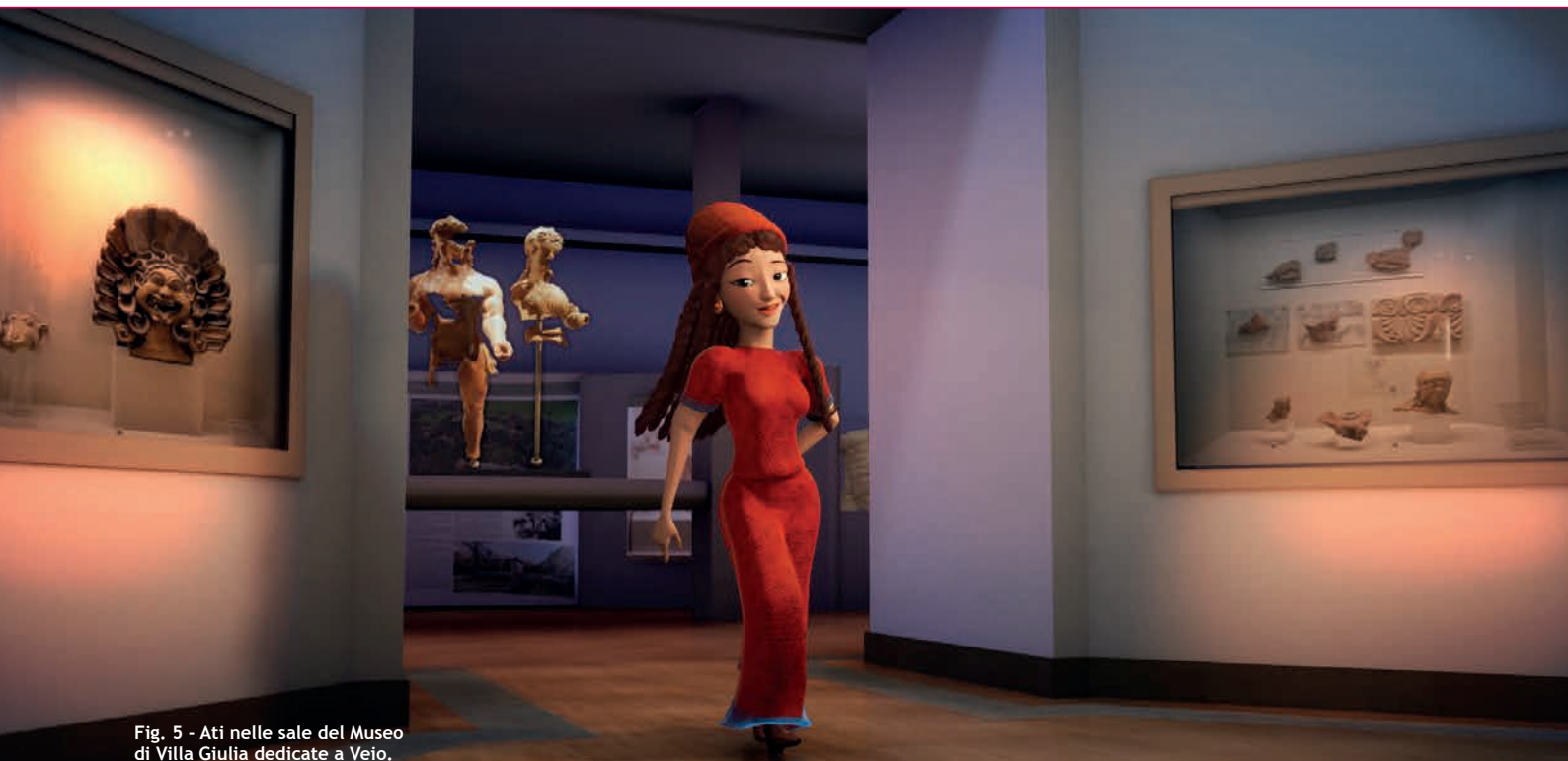
Fig. 5 - Ati nelle sale del Museo di Villa Giulia dedicate a Veio.

Anche il santuario di Portonaccio ha avuto una lunga vita, dal VI al III secolo a.C., e oggi i resti visibili nell'area ar-