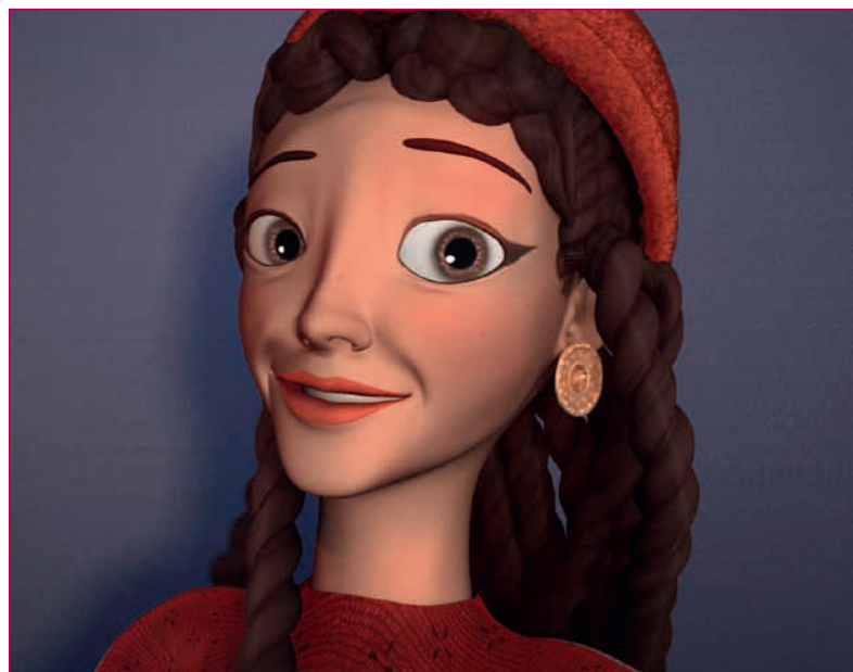
Fig. 3 - Primo piano di Ati. Si possono notare acconciatura e cappellino ispirati al Sarcofago degli Sposi e si vedono gli orecchini etruschi.

Al primo - il raffinato mondo dell'Etruria meridionale - ri-