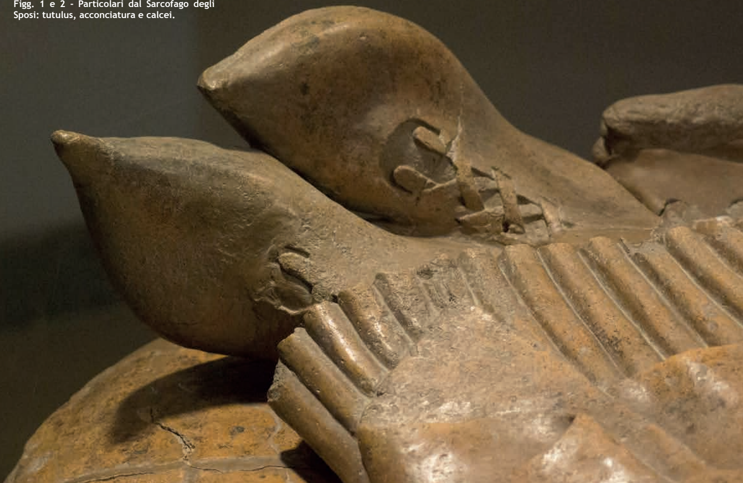
Figg. 1 e 2 - Particolari dal Sarcofago degli Sposi: tutulus, acconciatura e calcei.

molto differenti nel fisico per scelta degli archeologi del Museo di Villa Giulia. Si è voluto infatti sottolineare in questo modo, nella comune origine etrusca, la provenienza da ambiti territoriali e culturali diversi. L'idea originaria di creare una figura simile ad Apa anche nei modi è stata dunque concordemente abbandonata a favore di una immagine femminile che evocasse per stile e atteggiamento una dama dell'alta società dell'Etruria meridionale.