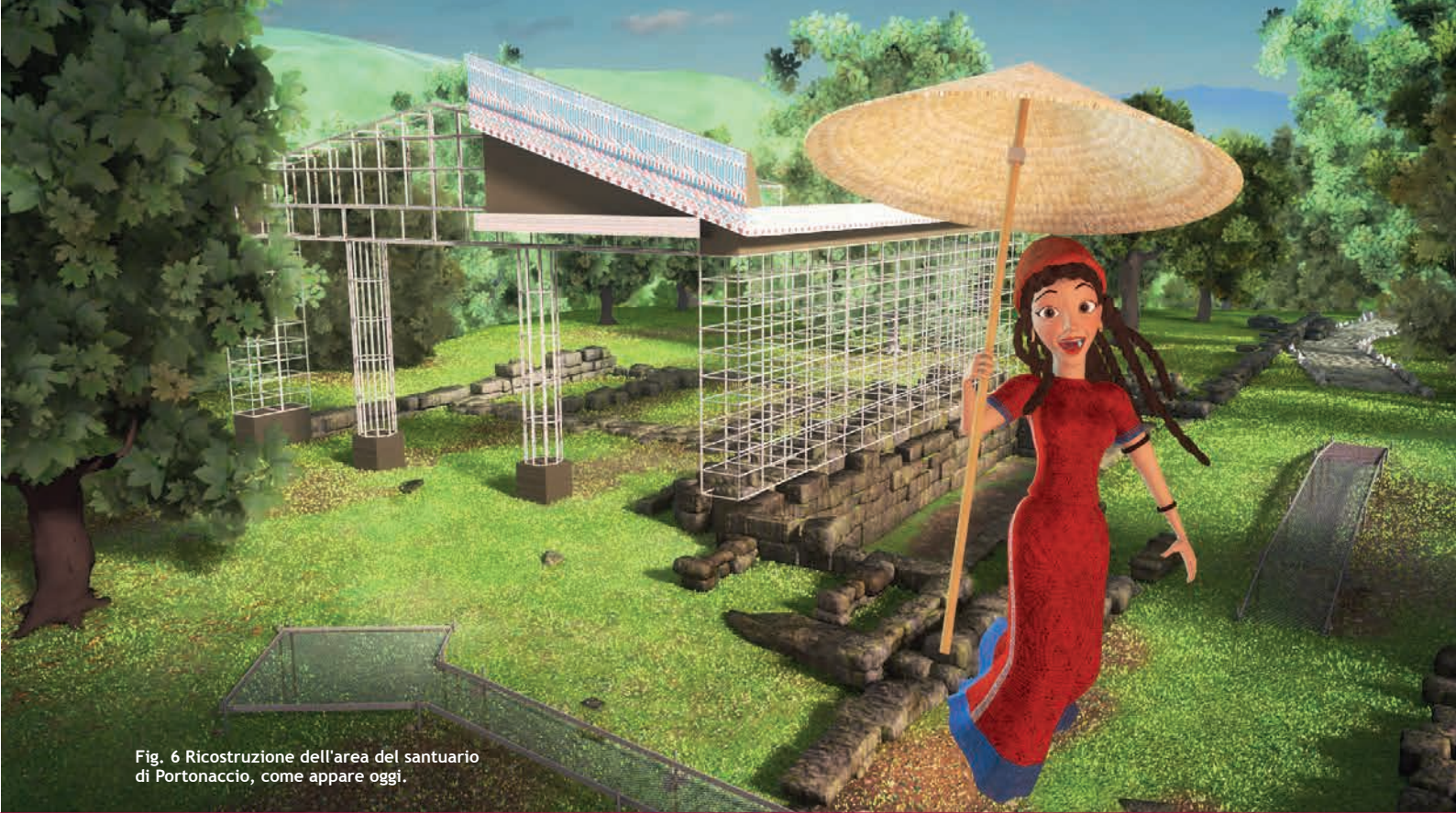
Fig. 6 Ricostruzione dell'area del santuario di Portonaccio, come appare oggi.

cheologica appaiono agli occhi del visitatore nel loro insieme, senza che sia immediatamente percepibile il rapporto cronologico che intercorre tra le varie strutture, realizzate in tempi diversi e dunque non presenti tutte insieme nello stesso momento.