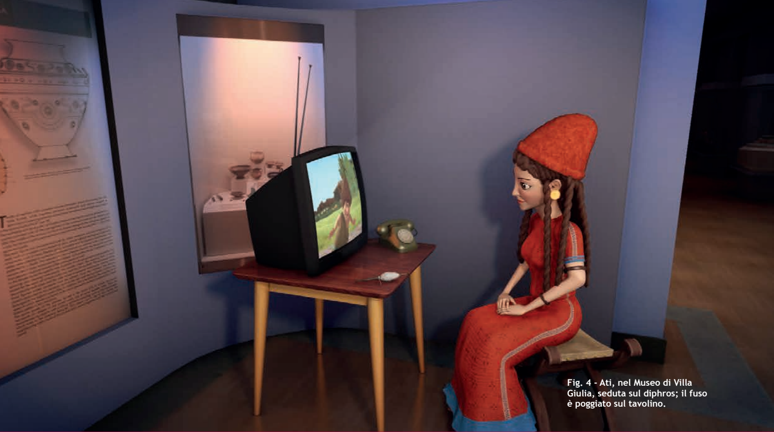
Fig. 4 - Ati, nel Museo di Villa Giulia, seduta sul diphros; il fuso è poggiato sul tavolino.

mandano il suo modo di vestire, di acconciarsi e di ornarsi con gioielli in voga verso la fine del VI secolo a.C.; al tempo di oggi rinvia l'ambientazione nelle sale del Museo di Villa Giulia che nel 2012 si sono rinnovate con un nuovo allestimento dedicato alla grande città etrusca di Veio.