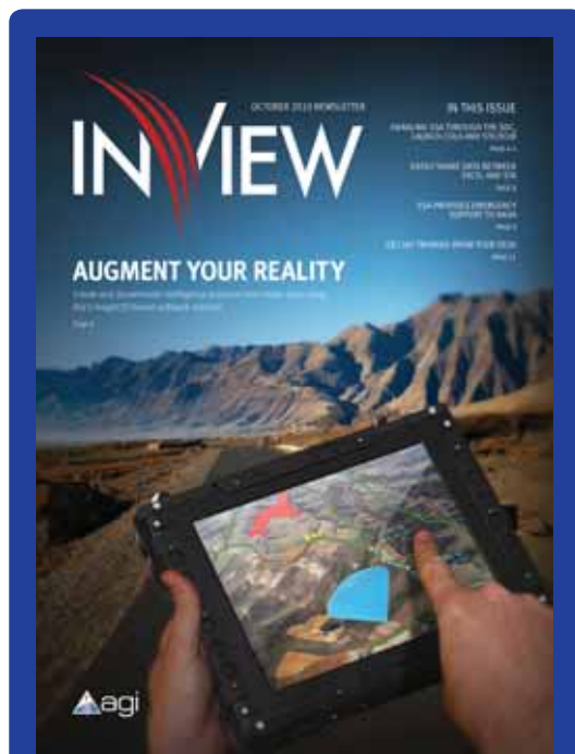
Figura 4 - La copertina del numero di ottobre 2010 di InView .

La copertina del periodico InView , pubblicato trimestralmente dalla AGI, orienta il suo focus sulla tematica og-