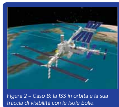
Figura 2 – Caso B: la ISS in orbita e la sua traccia di visibilità con le Isole Eolie.