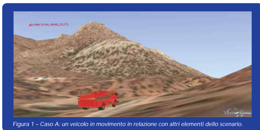
Figura 1 – Caso A: un veicolo in movimento in relazione con altri elementi dello scenario.

Come detto in precedenza, all'interno di questi strumenti a supporto della Augmented Reality, vengono fatte convergere varie tipologie di dati tra cui immagini satellitari a bassa, media ed altissima risoluzione, oltre a dati cartografici preesistenti. Queste immagini del territorio, acquisite da molti satelliti e da aerei equipaggiati con specifici sensori di rilevamento remoto (telerilevamen-