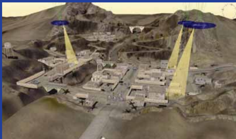
Figura 5 - Un esempio dell'utilizzo del prodotto SimMetrics.

getto della nostra disquisizione, illustrando con una sintesi efficace il concetto che sta alla base del paradigma dell'Augmented Reality, ovvero fondere insieme realtà e oggetti virtuali per muoversi al meglio con efficacia ed efficienza .