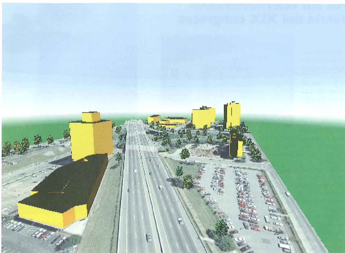
Elementi 3D visualizzati con Stero Analyst

con il software e renderli disponibili sul Web. Ormai un turista non ha più bisogno di recarsi in una agenzia di viaggi per programmare le proprie vacanze. Tutto quello che deve fare è accedere al Web e navigare sul proprio PC tra le varie località, nel comfort della sua casa. L'accessibilità al Web del software è una strada a doppio senso che consente agli utenti di creare link ai siti dall'interno degli ambienti. Quando, in futuro, un turista visiterà virtualmente una città, potrà cliccare su di un hotel o un ristorante e piuttosto che accedere a un data base, il sistema si collegherà al relativo sito. Il turista potrà quindi richiedere on-line la disponibilità delle stanze o i menu, dall'interno dell'ambiente virtuale. Per noi l'accesso diretto ai link del Web è un elemento che diventerà presto uno strumento di interrogazione standard in ogni vista GIS, sia 2D che 3D.