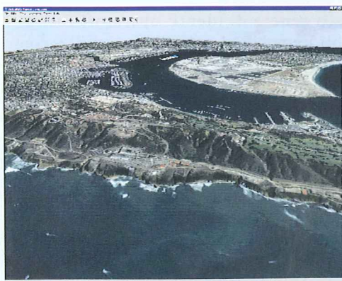
Immagine sovrapposta a un DEM con risoluzione IKONOS 4-metri