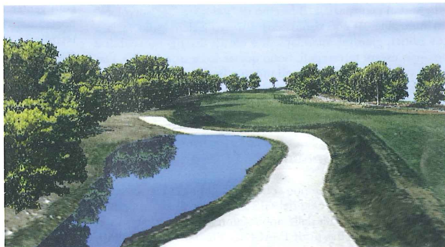
Mosaicatura di ortoeffimmagini

Nel 1995 introducemmo IMAGINE VirtualGIS, che essenzialmente fondeva il concetto fly-through con la tecnologia GIS. Oggi, quando le guardie forestali "navigano" negli ambienti basati sulle immagini, esaminando la topografia o la posizione degli alberi, possono interrogare l'ambiente per maggiori informazioni. In una vista 3D è sufficiente cliccare sugli oggetti, come ad esempio un bosco, perché si possa accedere al data base e ottenere i dettagli riguardanti le dimensioni, le specie dominanti o la data della loro messa a dimora. Oltre alle funzioni standard di interrogazione come le query del GIS, gli