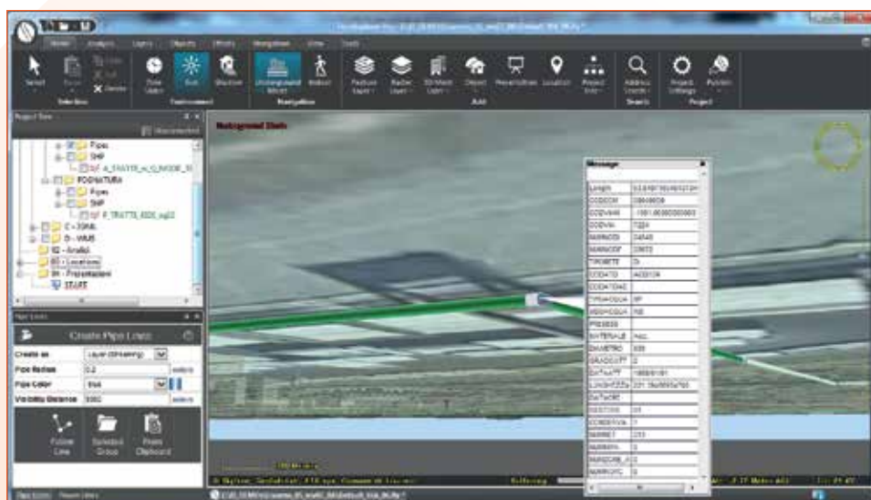
Fig. 6 - Interrogazione di Pipe Lines in TerraExplorer Pro, con visualizzazione Underground Mode attiva (visione delle reti dal sottosuolo).

L'ambiente GIS 3D by Skyline offre la possibilità di integrare facilmente dati sottosuolo e sovrasuolo.