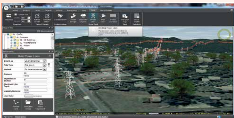
Fig. 7 - Power Lines Tools in TerraExplorer Pro, per la visualizzazione di reti elettriche sovrasuolo.