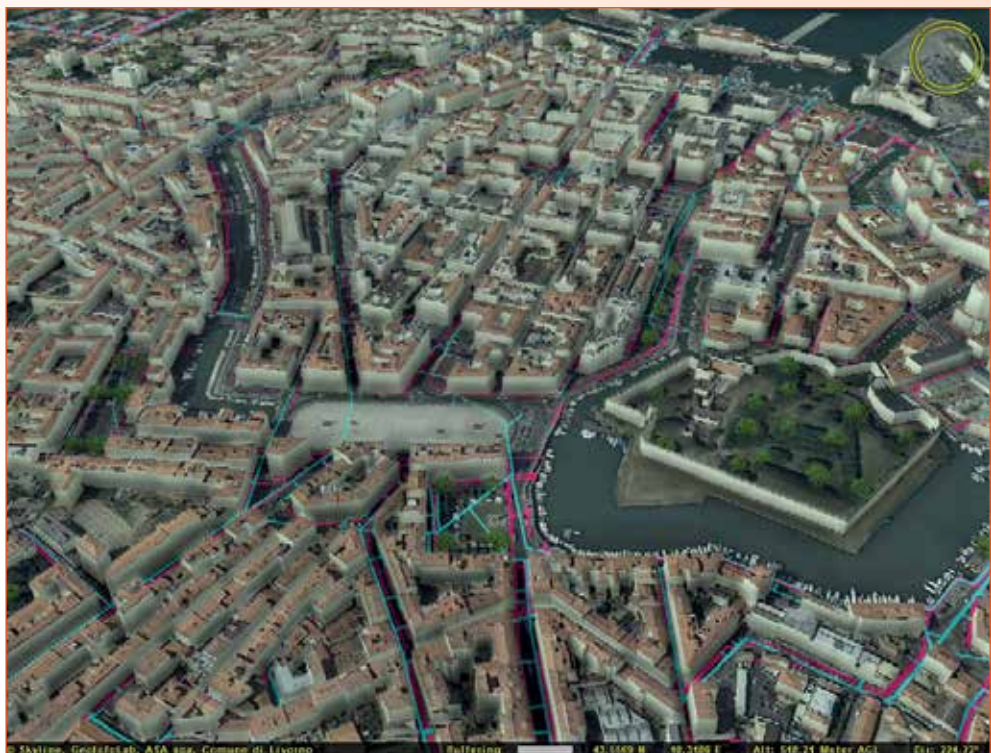
Fig. 1 - Distribuzione di acquedotto e fognatura nel centro di Livorno (dati ASA spa e Comune di Livorno, elaborazione GeoInfoLab in ambiente 3D GIS by Skyline).

Le organizzazioni che gestiscono le reti tecnologiche del sottosuolo richiedono, con forza sempre maggiore, sistemi informativi adeguati al corso dei tempi e sono ormai diverse le case produttrici di software/hardware che propongono soluzioni per la mappatura. In questo lavoro si illustra la soluzione GIS 3D/4D proposta da Skyline per la visualizzazione delle reti e per la loro interrogazione: una procedura semplificata per la visualizzazione ed una leggermente più complessa per l'interrogazione dei dati alfanumerici.