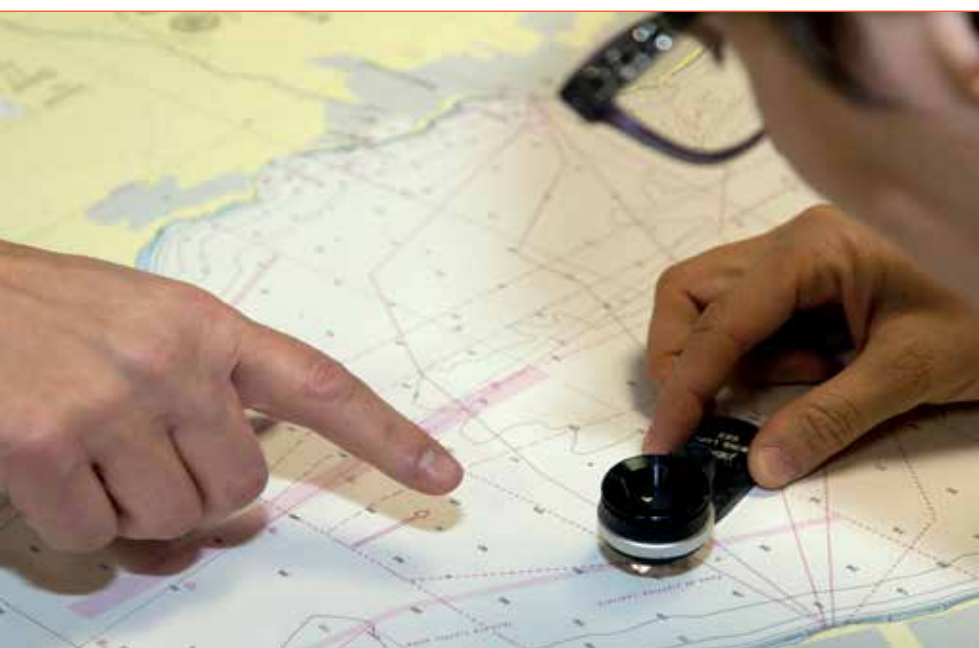
Fig. 11 - Verifica della qualità di stampa di una carta, 2017, IIM, Genova

Visualizzata sull'ECDIS, la carta elettronica assomiglia molto a una carta tradizionale, ma contiene tutte le informazioni relative a ogni singolo elemento e consente la visualizzazione delle caratteristiche descrittive e spaziali di qualsiasi oggetto rappresentato, selezionandolo semplicemente con il cursore. Oltre alle informazioni strettamente necessarie per la sicurezza della navigazione, contenute anche nella cartografia nautica tradizionale (informazioni geografiche, idrografiche, ge-