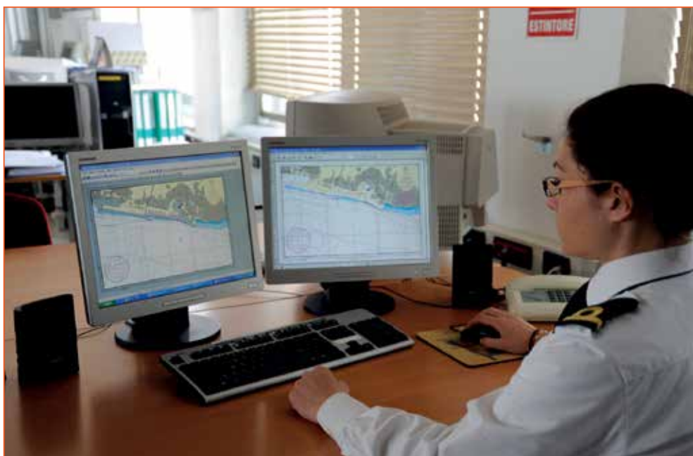
Fig. 3 - Ufficiale idrografo al computer per l'elaborazione della cartografia elettronica, 2009, IIM, Genova.