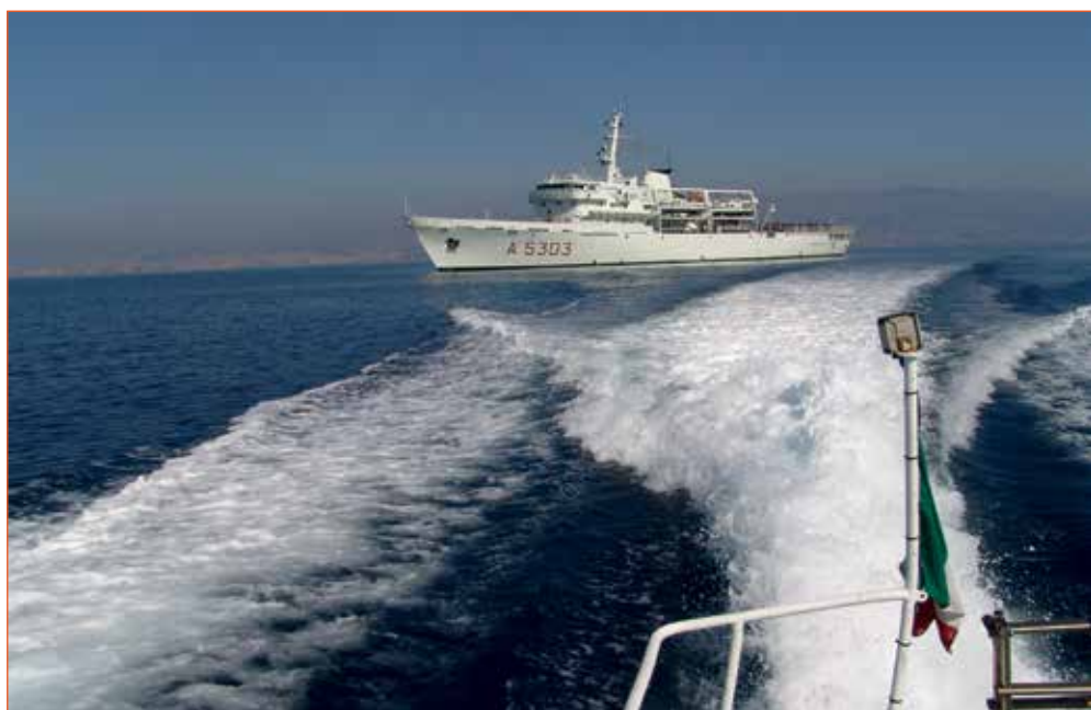
Fig. 7 - Nave idro-oceanografica Ammiraglio Magnaghi, 2005, IIM, Genova

I dati satellitari per la stima della profondità sono in generale meno accurati di quelli ottenuti con sistemi acustici, ma più rapidamente e facilmente disponibili. La SDB ( Satellite