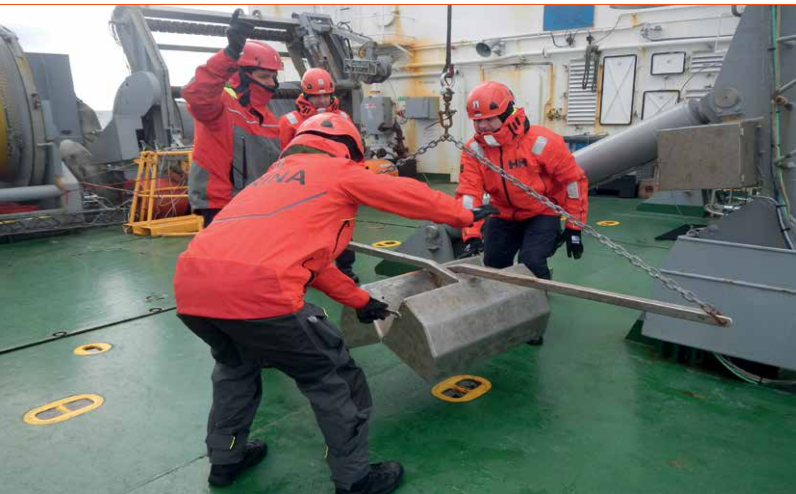
Fig. 9 - Operazioni con la benna di tipo Van Veen sulla nave oceanografica Alliance, 2017, IIM, Genova

I dati idrografici rappresentano solo una parte delle caratteristiche essenziali delle banche dati