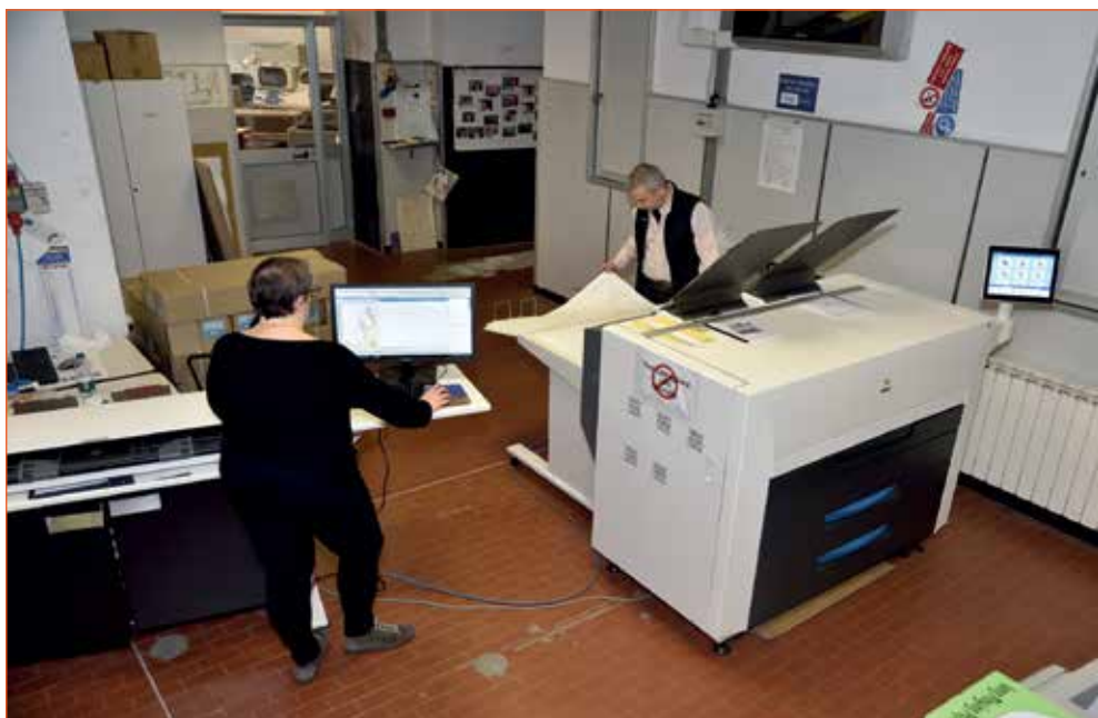
Fig. 5 - Nuova macchina da stampa per le carte nautiche - l'evoluzione tecnologica non si ferma mai, 2018, IIM, Genova

Tale documentazione, infatti, è una materia viva, e proprio