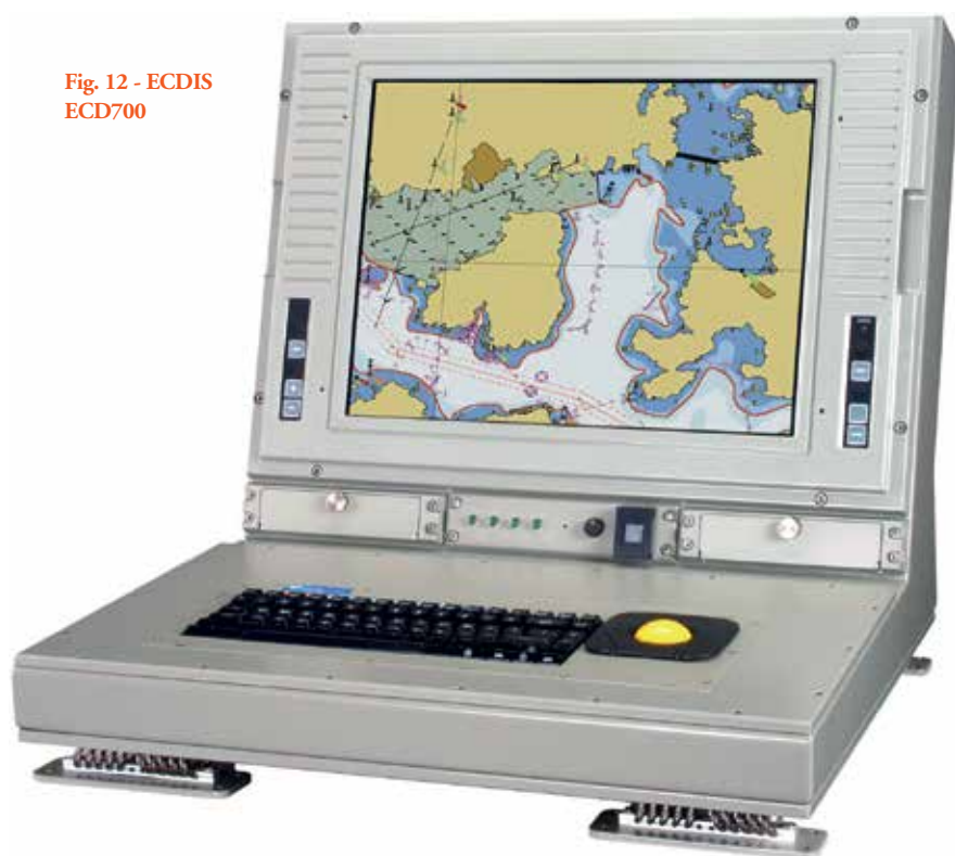
Fig. 12 - ECDIS ECD700

giornamento. Infatti, una volta sottoscritto il servizio di fornitura ENC, gli aggiornamenti arrivano all'utilizzatore sotto forma di file di dati. Il navigante deve solo assicurarsi di caricare il file di aggiornamento, senza ulteriore dispendio di tempo e di lavoro.