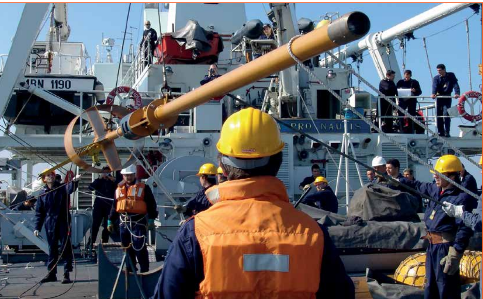
Fig. 8 - Operazioni di carotaggio a bordo della nave idro-oceanografica Ammiraglio Magnaghi, 2005, IIM, Genova

rino. Queste informazioni comunque, hanno la necessità di rispettare degli standard di qualità basilari, stabiliti dall'IHO. Al fine di rendere disponibili le misure raccolte per gli utilizzi più diversi, primo fra tutti la costruzione delle carte nautiche, le stesse vanno processate e corrette con software dedicati e in grado di gestire una grande quantità di dati in maniera molto veloce (dell'ordine delle decine di gigabyte per volta). La misurazione della velocità di propagazione del suono lungo la colonna d'acqua viene effettuata con sonde cosiddette SVP ( Sound Velocity Profiler ). E' un dato essenziale per garantire il migliore funzionamento degli ecoscandagli. Il suo profilo, infatti, viene sempre inserito nel software di acquisizione o in post-processing , e permette di effettuare il cosiddetto ray tracing , ossia individuare la corretta propagazione dei raggi acustici, per applicare alle mi-