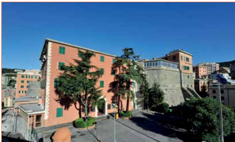
Fig.2 - La sede dell'Istituto Idrografico della Marina.

la profondità con precisione occorrono strumenti sofisticati e calcoli complessi, che tengano conto di molti fattori: ad esempio, le maree e le variabili chimico-fisiche dell'acqua (salinità, temperatura, ecc.). L'Istituto Idrografico della Marina, fondato a Genova nel 1872, quale Organo cartografico dello Stato, è responsabile