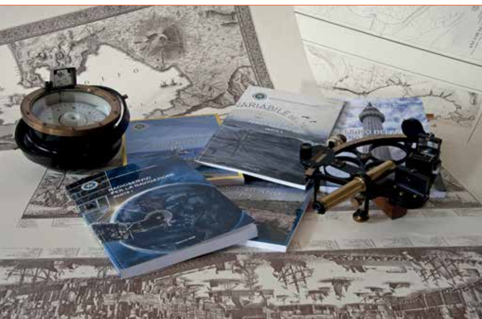
Fig. 4 - Pubblicazioni dell'Istituto

L'incisione era invece indiretta quando, con una punta metallica, si incideva, sempre con il disegno a rovescio, uno strato