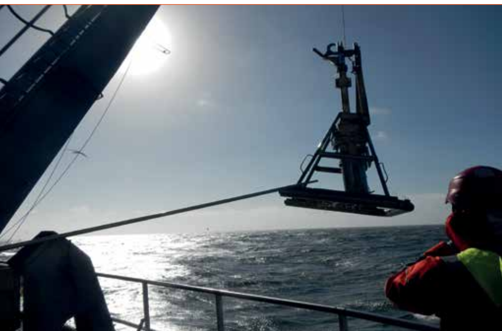
Fig. 10 - Recupero del box corer a bordo della nave oceanografica Alliance, 2017, IIM, Genova

in cui vengono pubblicati e condivisi. I dati e la loro struttura devono corrispondere a precisi standard internazionali, onde evitare errori e incomprensioni. È poi fondamentale integrarli in un più ampio sistema di gestione delle regole di condivisione e di copyright . Infine, vanno inseriti in un'infrastruttura informatica che li pubblichi e ne permetta lo scambio.