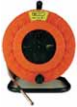
FREATIMETRO CON TEMPERATURA