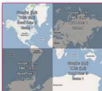
Figura 1 - Modalità di indicizzazione dei tiles.

una stima dell'utilizzo tipico di elettrodomestici), la fornitura di indicazioni riguardanti l'ambiente circostante (albedo e rugosità del terreno) ed eventuali vincoli strutturali (massima area e/o altezza fruibili). Questi input permettono al simulatore di calcolare le migliori soluzioni tecnologiche proponendo all'utente da una a tre configurazioni (fotovoltaica, solare termica, minieolica), escluse quelle non redditizie. Infine è offerta la possibilità di beneficiare di un finanziamento, per poi ottenere il report finale comprensivo di tecnologia suggerita, progettazione e preventivazione con anni di ritorno dall'investimento.