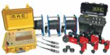
ULTRASUONI CROSS-HOLE A6000U