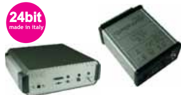
DATA LOGGER 4 - 8 - 16 - n... CANALI