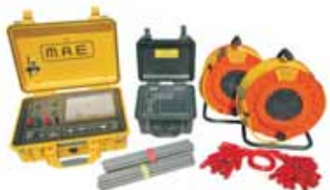
PROSPEZIONE GEOELETTRICA A6000E