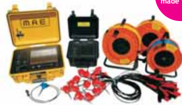
PROSPEZIONE SISMICA A6000S