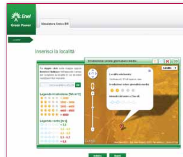
Figura 2 - Esempio d'interrogazione puntuale di località.

Per abilitare le funzionalità di click su mappa e quindi consentire all'utente di selezionare un punto sulla mappa webGIS e di ottenere informazioni relative al layer attivo (irradiazione o intensità del vento), viene interrogato tramite la tecnologia AJAX un database PostgreSQL. Tale database contiene le stesse informazioni delle immagini visualizzate,