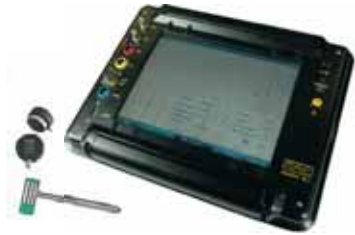
ANALIZZATORE ULTRASUONI S310-U