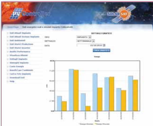
Figura 5- Esempio di confronto tra dati energetici reali e simulati relativi ad un impianto fotovoltaico monitorato.

Si tratta di un sistema integrato hardware-software che consente il controllo e la gestione remota via web di impianti fotovoltaici di ogni dimensione. L'interfaccia di monitoraggio, attualmente distribuita tramite sito web, sarà presto resa accessibile anche tramite un'applicazione iPhone in fase di sviluppo.