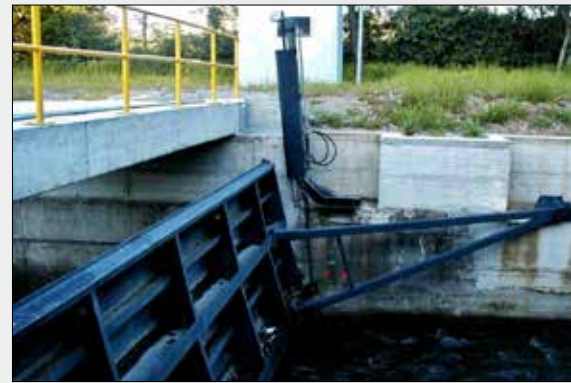
Fig. 2 - Tidal gate.

Il secondo progetto prevede l'implementazione, attraverso personale specializzato, di diverse soluzioni innovative tra