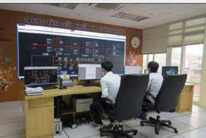
Fig. 1 - SCADA Control Center.

In questi anni Proteo CT ha maturato esperienza nel campo dell'automazione e del controllo