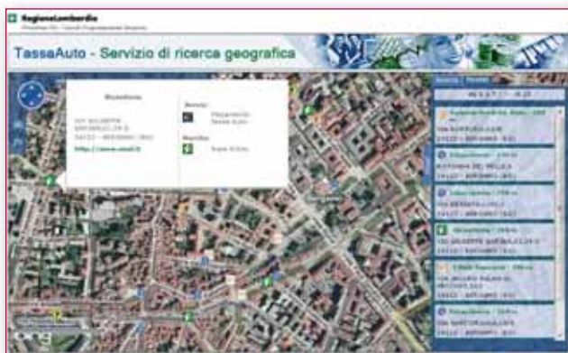
Figura 5 - Esempio di servizio ai cittadini.

Per venire incontro a queste esigenze (ad esempio supportare il tecnico comunale che debba sovrapporre dei dati rilevati in sito ad alcuni livelli informativi della CTR, ora ancora in Gauss Boaga), la Regione mette a disposizione nel GeoPortale un servizio web per la trasformazione di punti e di file geografici in formato ESRI Shapefile, consentendo le conversioni nei sistemi di riferimento più diffusi, vale a dire quelli geografico, Gauss-Boaga e UTM32 WGS84.