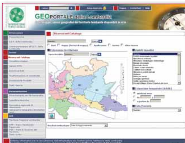
Figura 2 – La funzione di ricerca nel Catalogo dell'Informazione Territoriale.

gli utenti possono facilmente eseguire ricerche di mappe, banche dati, documenti, applicazioni e servizi geografici relativi al territorio lombardo. E' interessante notare che le informazioni descrittive dei dati e dei servizi geografici esistenti in Lombardia sono inserite anche dagli stessi soggetti produttori delle risorse geografiche (comuni, province, comunità montane, aggregazioni di enti locali, ecc.), sottoscrittori degli accordi di partecipazione alla IIT.