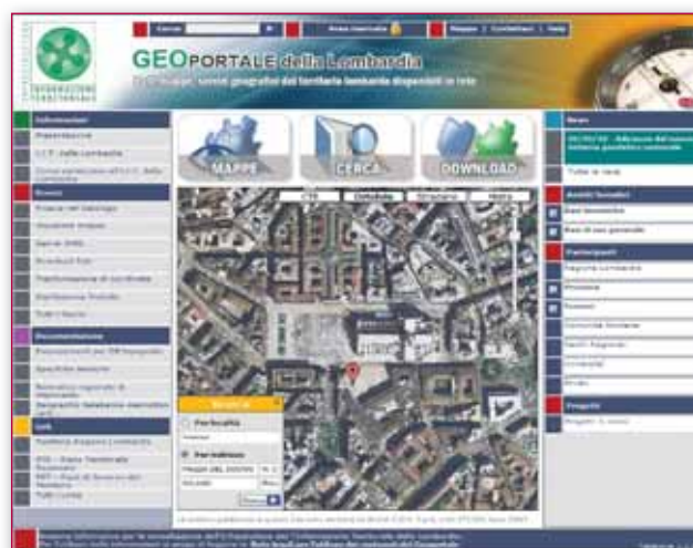
Figura 1 - Il Geoportale della Lombardia.

Per gestire questo processo – sulla base della Direttiva Comunitaria INSPIRE per lo sviluppo di una Spatial Data Infrastructure (SDI) europea – Regione Lombardia ha avviato, con il supporto di Lombardia Informatica, la realizzazione di una Infrastruttura per l'Informazione Territoriale (IIT). Dal punto di vista normativo, un'ulteriore spinta ad un approccio condiviso nella gestione, conoscenza e utilizzo dell'informazione territoriale, viene fornita dalla Legge Regionale di Governo del Territorio (L.R. 12/2005), che pone forte rilievo sul ruolo del Sistema Informativo Territoriale Integrato (SITI) nei processi di pianificazione, sottolineando la necessità di una forte sinergia tra le Pubbliche Amministrazioni lombarde.