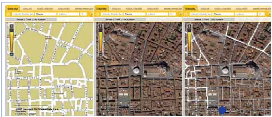
Figura 2 - Visual: le 3 principali viste a confronto, mappa, ortofoto e mista

Successivamente, si provvede a creare una struttura piramidale dell'immagine completa, in cui ogni livello è formato da una copia dell'immagine originale opportunamente sotto-campionata ( down-sampling ). Questo trattamento consente di ottenere un risultato estremamente importante: le immagini vengono inviate all'utente solo alla risoluzione minima per visualizzare correttamente ciò che viene richiesto; a maggiore richiesta di dettaglio maggiore sarà la risoluzione utilizzata, ma minore sarà l'area visualizzata. I primi due processi sono essenziali per limitare la dimensione delle immagini trasmesse sulla rete ma non bastano ancora a dare una visualizzazione rapida, ed è necessario ritagliare le immagini ai vari livelli della piramide in