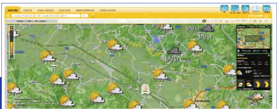
Figura 6 - Previsioni meteorologiche per singoli comuni

La copertura territoriale è in costante aumento e attualmente comprende più di 100 città, con una base dati di circa 15 TB. Uno degli sforzi maggiori in questa attività è la geocodifica di tutte le foto, senza la quale avremmo una quantità enorme di materiale del tutto inutile, perchè sarebbe impossibile associare ad una foto un luogo reale o un indirizzo specifico. Grazie a questa immensa base dati sarà possibile non solo