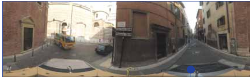
Figura 9 - Proiezione 2D di una foto sferica (360°)

Una volta terminata la geocodifica è possibile infatti sovrapporre alla facciata di ogni edificio un'immagine ritagliata da una delle foto scattate nelle vicinanze (opportunamente corretta da distorsione radiale e proiettata sul piano della facciata), ottenendo una rappresentazione foto-realistica dei quartieri di una città.