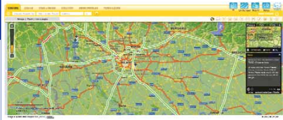
Figura 7 - La situazione viabilità delle tangenziali milanesi