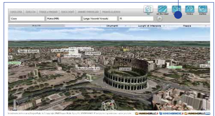
Figura 10 - Volo 3D su Roma, in evidenza i modelli di alcuni edifici e dei monumenti

L'innovazione nella creazione di cartografia ricca di contenuto informativo e di alta qualità, e l'aggiunta di servizi di geocodifica consentono di localizzare sulle mappe milioni di famiglie, attività commerciali e luoghi di interesse. Oggi i servizi on-line sono utilizzati da milioni di utenti ogni giorno, e i 200 server di erogazione forniscono un'impressionante mole di dati, rispondendo alle richieste più eterogenee, siano esse la necessità di scoprire le strade alternative per un viaggio, di sapere che tempo farà in un luogo preciso o in piccolo comune o la semplice curiosità di vedere la foto del tetto della propria abitazione. Il futuro è rappresentato dall'introduzione della terza dimensione, per consentire forse tra pochi anni una visita virtuale non più all'interno di un palazzo (come un museo per esempio) o di una città con l'alzato degli edifici, ma in vere e proprie ricostruzioni fedeli e realistiche dell'area urbana, in cui siano rappresentati correttamente tutti gli elementi architettonici, tetti, finestre, marciapiedi, lampioni e quant'altro dia vita ad una rappresentazione emotivamente coinvolgente per l'utente. G