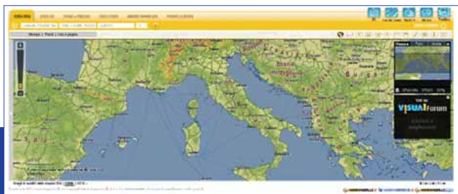
Figura 1- Schermata principale di Visual, il portale visuale di Pagine Gialle

Visual è il principale punto di accesso ai servizi di Pagine Gialle. Tecnicamente si tratta di un'applicazione web scritta su piattaforma Flash, che risponde all'indirizzo http://visual.paginegialle.it .