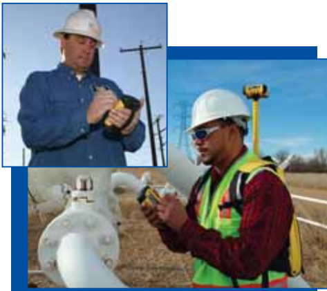
Figura 2 - Due operatori che attraverso l'uso del GPS e di una soluzione mobile GIS sono in grado di effettuare un aggiornamento della banca dati geografica in tempo reale

eseguire misurazioni e analisi GIS direttamente sul campo.