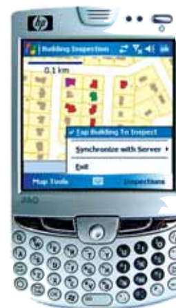
Figura 1 - Un tipico apparato smartphone HP impiegabile per attività di mapping GIS

A seguito della diffusione delle tecnologie Mobile GIS, e potendo operare sul campo con mappe aggiornate in tempo reale, è stato possibile per le diverse organizzazioni di velocizzare i processi di decision making , grazie all'accuratezza delle informazioni e al fatto che i database vengono aggiornati in tempo reale.