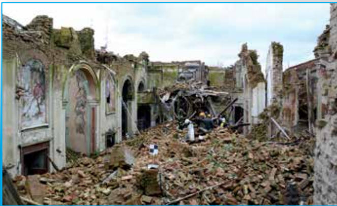
Fig. 1 - Vista interna della chiesa di San Geminiano a San Felice sul Panaro.

di Caterina Balletti, Francesco Guerra, Paolo Vernier