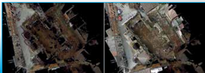
Fig. 6 - Vista della nuvola di punti rilevata con il laser FARO Focus 3D (a sinistra), e del modello finale ottenuto integrando i dati terrestri con quelli da UAV.