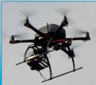
Fig. 2 - L'esacottero della Mikrokopter utilizzato nel rilievo fotogrammetrico da UAV, fondamentale per l'integrazione dei dati laser scanning terrestri.

colar modo delle coperture, di fondamentale importanza per pianificare le prime opere di messa in sicurezza, ha condotto all'esecuzione di un rilievo fotogrammetrico da UAV. Quest'ultimo metodo risulta particolarmente utile in zone terremotate perché permette di documentare gli edifici danneggiati senza mettere a rischio la sicurezza dell'operatore e di acquisire dati di aree difficilmente raggiungibili con altri metodi.