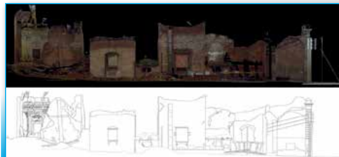
Fig. 7 - Dai dati rilevati si sono ricavati sia le ortofoto che i profili orizzontali e verticali per la realizzazione di elaborati grafici, punto di partenza per le successive analisi in ambito conservativo.

Il risultato ottenuto è adatto per una rappresentazione alla scala nominale 1:50 e costituirà il punto di partenza per le successive analisi in ambito conservativo.