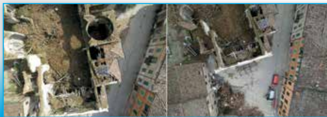
Fig. 4 - I fotogrammi sono stati acquisiti con la camera Canon Powershot S100, una camera compatta sufficientemente leggera da essere alzata in volo dall'esacottero, ma con una buona risoluzione (12Mpx).

Per la definizione del piano di volo sono stati presi in considerazione la scala dei fotogrammi, il loro ricoprimento a terra, la lunghezza focale della camera, la sovrapposizione tra i vari fotogrammi, l'altezza del volo e la distanza tra i centri di proiezione. Grazie ai sensori di posizionamento incorporati, l'UAV può volare sia in modalità assistita che in modalità autonoma. Infatti, i waypoint possono essere identificati manualmente su una foto aerea georeferenziata attraverso il software di controllo del velivolo e trasmessi al drone per definire il piano di volo.