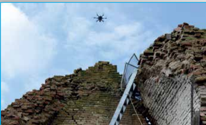
Fig. 3 - Il drone in fase di volo assistito sopra le macerie della chiesa.

Il velivolo utilizzato è un esacottero della Mikrokopter, caratterizzato da un'autonomia di volo di 10-12 minuti, naturalmente variabile a seconda delle condizioni di vento e del peso del carico sollevato (max 250-300 gr). L'UAV utilizza un sensore GPS con antenna planare e una serie di sensori integrati (un accelerometro triassiale MEMS, tre giroscopi MEMS, un sensore di campo magnetico triassiale e un sensore di pressione a 12 bit) per determinarne la posizione e l'assetto in volo. Il sistema permette sia di registrare i dati di telemetria su una micro SD collocata a bordo del ve-