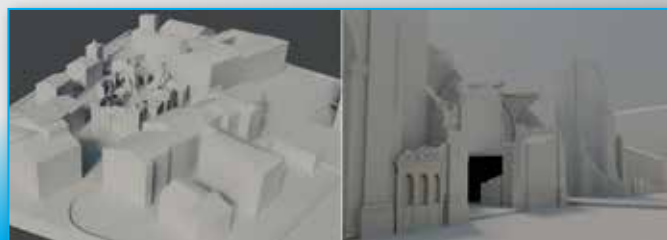
Fig. 8 - Il rilievo ha permesso di realizzare un modello 3d dello stato attuale della chiesa fondamentale sia nello studio dei nodi strutturali rimasti che per la progettazione di opere provvisorie di copertura.