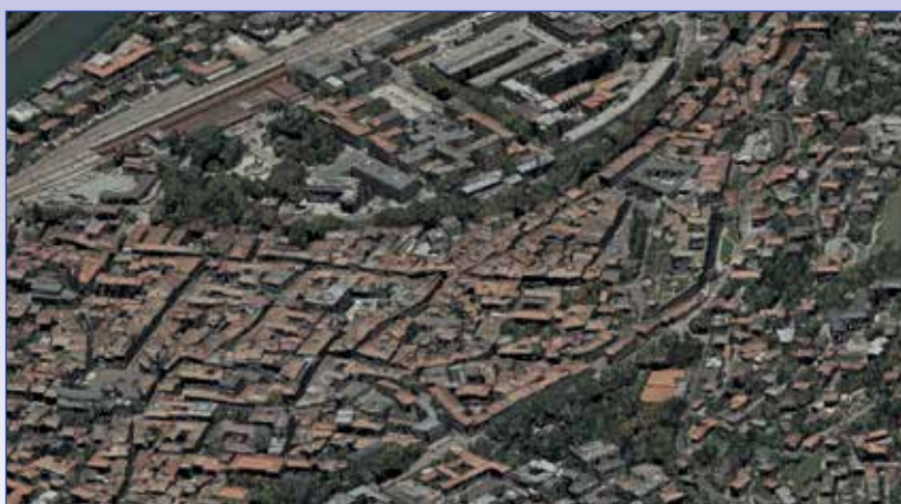
Fig. 3 - Nuvola di punti densa del centro storico di Trento generata da immagini aeree con un GSD di 10 cm (volo AVT Terra MessFlug, 2013).

Numerosi software commerciali e open-source sono disponibili per il processamento automatico delle riprese aeree e terrestri in modo rigoroso e per la generazione di nuvole dense di punti 3D. L'elevato grado di automazione del processo fotogrammetrico ha portato alla realizzazione di soluzioni black box , anche open-source, che permettono di ottenere modelli 3D con un semplice click, rendendo facile la modellazione 3D da immagini anche ai non esperti. Tuttavia gli aspetti metrologici e l'affidabilità di questi metodi non dovrebbero essere trascurati, soprattutto se si intendono adottare tali soluzioni non solo per la ricostruzione 3D in tempo reale e la visualizzazione su web, ma anche per scopi di misurazione precisa. A tal proposito, va ricordato che le restituzioni fotogrammetriche si basano sempre su misurazioni ridondanti (2 o più raggi omologhi) e le stime delle coordinate 3D sono sempre