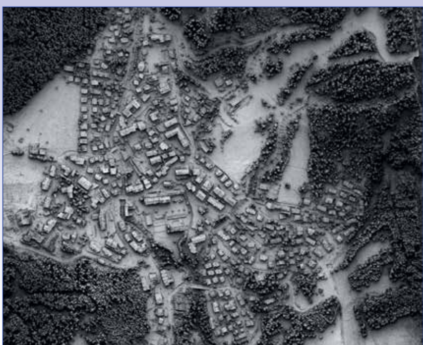
Fig. 6 - Nuvola di punti generata da immagini acquisite con una camera reflex montata su un elicottero (sistema HeliArm, Smart3K).

DANIELA POLI d.poli@terra-messflug.at Vermessung AVT / Terra Messflug, Imst, Austria. http://www.terra-messflug.at