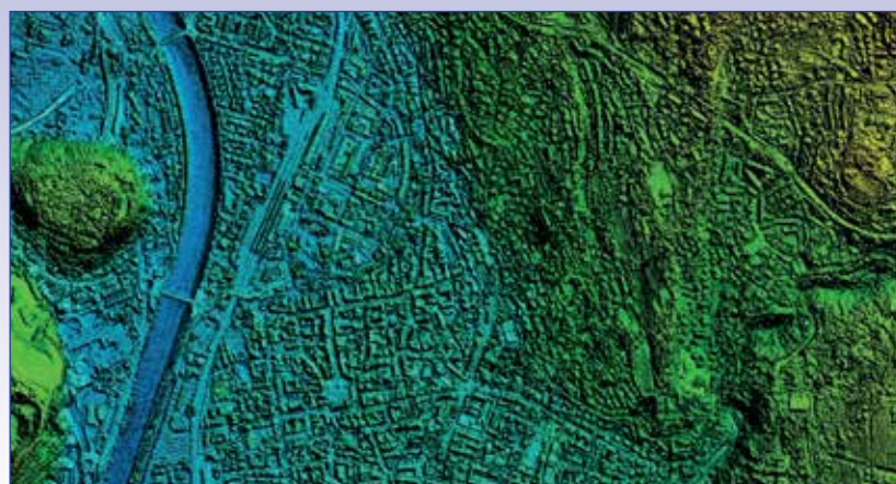
Fig. 2 - Visualizzazione colour-code del modello digitale di Trento città (volo AVT Terra Mess-Flug, 2013, GSD di 10 cm).

Recentemente, grazie ai miglioramenti dell'hardware e a nuovi algoritmi sviluppati soprattutto nel settore della Computer Vision, la fotogrammetria è riemersa come una tecnologia competitiva e in grado di fornire, in maniera automatica, nuvole di punti 3D e modelli digitali della superficie geometricamente paragonabili