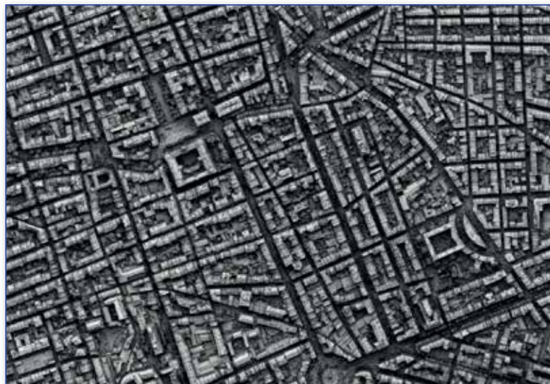
Fig. 1 - Nuvola di punti da immagini aeree (GSD 10 cm) sul centro storico di Marsiglia visualizzata in modalità shaded.

IN QUESTI ULTIMI ANNI LA TECNICA FOTOGRAMMETRICA È STATA OSCURATA DALLA SENSORISTICA ATTIVA, TECNOLOGIA IN GRADO DI FORNIRE NUVOLE DI PUNTI DENSE, DETTAGLIATE E ACCURATE IN MODO SEMPLICE E RAPIDO. OGGI, LA TECNICA FOTOGRAMMETRICA, RIEMERGE COME TECNOLOGIA COMPETITIVA IN GRADO DI FORNIRE MODELLI DIGITALI PARAGONABILI A QUELLI OTTENUTI CON LA STRUMENTAZIONE ATTIVA.