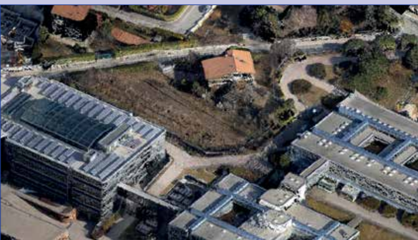
Fig. 4 - Nuvola di punti da piattaforma UAV/ RPAS/drone degli edifici di FBK (Trento).

pubblici stanno prendendo consapevolezza delle potenzialità dei recenti sviluppi tecnologici nel campo fotogrammetrico (in particolare il dense image matching ) e stanno scegliendo queste tecniche invece di quelle basate su scansioni laser, laddove possibile, per la generazione di nuvole dense 3D. Inoltre i costi ridotti degli strumenti e delle piattaforme (es. droni) e la disponibilità di soluzioni software black-box stanno favorendo la diffusione delle tecniche fotogrammetriche anche tra le comunità di non esperti. Senza dubbio la tecnica laser rimane uno strumento indispensabile in tutte le analisi che riguardano la valutazione dei volumi in ambiti forestali o comunque con importante presenza di vegetazione sul terreno.