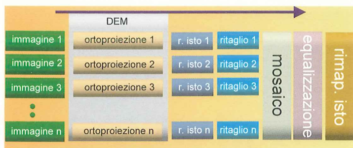
Figura 3 - Pipeline per la generazione di un ortomosaico