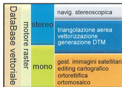
Figura 1 - Architettura del sistema Z-Map

Sul DataBase geometrico si appoggiano tutte le funzionalità, sia quelle che operano in modalità stereoscopica che monoscopica; per alcune di esse, quali la triangolazione aerea, la vettorizzazione e la generazione automatica del DTM viene offerta la possibilità di operare sia in modalità mono che stereo.