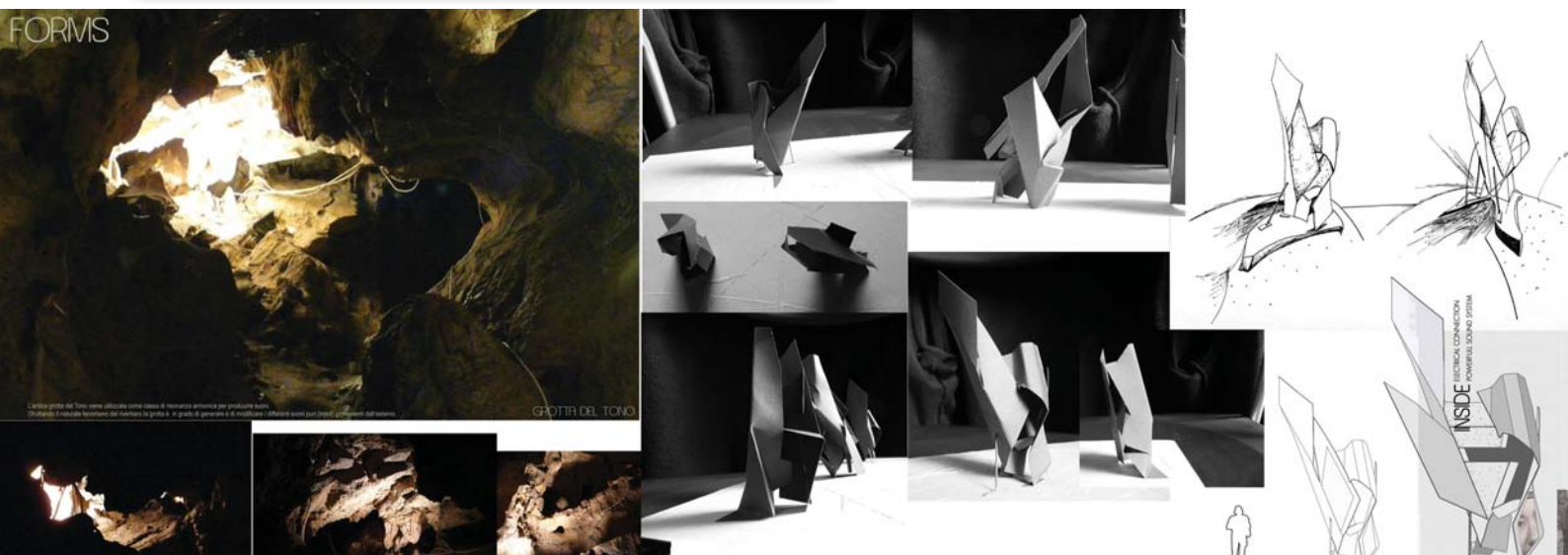
La cattedra del Tono viene utilizzata come cassa di risonanza armonica per produrre suoni. Il suono è raccolto tramite dei microfoni in grado di generare il suono e di riprodurlo attraverso altoparlanti per creare un network di scambio di informazioni.