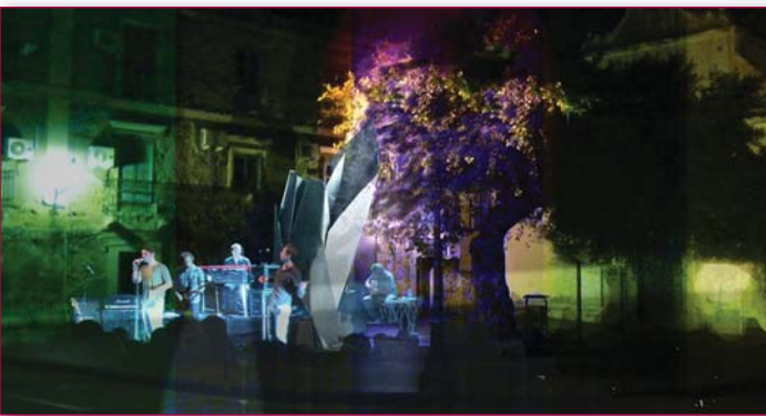
Figura 7-8 - Suoni e nuovi luoghi urbani a partire dalla grotta preistorica del Tono a Gioiosa Marea, Progetto di Christian Farinella e R. Kelley. Workshop del Sicily Lab di Gioiosa Marea (Saggio con Del signore e Goodwain Tulane U.)

Il lavoro di Fatica e Guevara ipotizza delle microsituazioni urbane per la ricollocazione dei reperti storici e archeologici che vengono inseriti direttamente negli spazi della cittadina, piuttosto che chiusi a chiave in un piccolo ambito municipale.