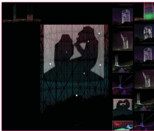
Figura 4 - Jam Frequency. Il Gasometro di Roma come trasmettitore di Informazioni. Progetto di Marco Olivieri, Federico Pitzalis, Janni Gordon, Alessandro Marinelli. Corso di Informatica e Architettura prof. Saggio, Sapienza Università di Roma.