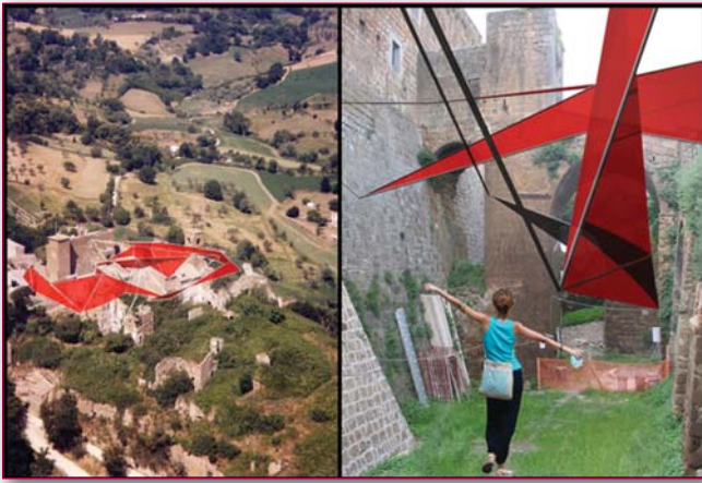
Figure 1-2-3 - L'arte di ridare la vita. Progetto per il paese medioevale abbandonato di Celleno (VT) Progetto di Caterina Naglieri, Cosimo Pellicchia, Alessandro Marinelli. Corso di Informatica e Architettura del prof. Saggio, "Sapienza" Università di Roma.

Cerchiamo di riflettere su cosa questo significhi per il nostro tema. E cioè quale sia l'impatto della Information Technology nel contesto dei paesi abbandonati, (un tema molto importante e di continua attualità in Italia anche in rapporto ad eventi calamitosi) e per molti dei siti archeologici che per una ragione o per l'altra sono letteralmente abbandonati a se stessi, in particolare nel Sud d'Italia.