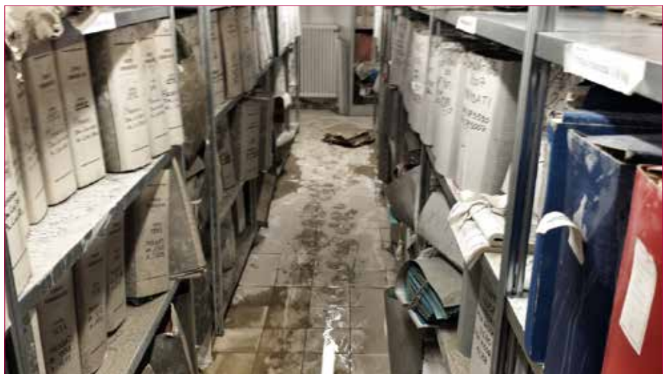
Fig.1 - Archivio allagato.

Il recupero dei Beni documentali danneggiati dalle inondazioni si può fare con le attuali tecnologie avanzate, che sono state create nel corso degli anni dalla conoscenza combinata di esperti restauratori, biologi e ingegneri, e che ora vengono impiegati in tutto il mondo da industrie e organizzazioni interessate nel campo della conservazione dei beni culturali.