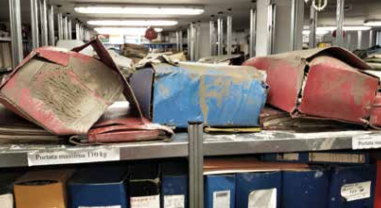
Fig. 4 - Danni da acqua su faldoni.

Una volta catalogati e identificati univocamente, in modo da poter essere sempre tracciabili, i documenti inseriti in buste di plastica possono essere posizionati all'interno di bins o caricati su pallet e imballati per poi essere inseriti in appositi container refrigeranti. All'arrivo in laboratorio, le buste contenenti i documenti congelati vengono aperte, e i documenti vengono inseriti all'interno del liofilizzatore, divisi in gruppi di carte e inframmezzati da appositi supporti plastici al fine di ottimizzare l'efficacia del trattamento. Il processo di liofilizzazione ha una durata variabile a seconda della quantità e del tipo di materiale inserito all'interno dell'autoclave, da un minimo di 12 ad un massimo di 60 ore. Al termine del procedimento di liofilizzazione, le carte asciutte vengono, se necessario, sottoposte a pulitura da restauratori. La spolveratura avviene mediante l'impiego di pennelli a setole morbide sotto cappe aspiranti provviste di filtri HEPA e successivamente le carte vengono spianate e ricondizionate.