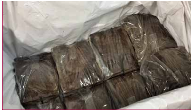
Fig. 2 - Documenti imbustati prima della liofilizzazione.

Nel caso si tratti di un evento di grosse dimensioni, con una grande quantità di materiale interessato, la liofilizzazione è l'unico processo in grado di assicurare l'asciugatura e la