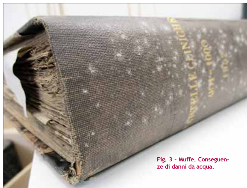
Fig. 3 - Muffe. Conseguenze di danni da acqua.

Quando si verifica un'emergenza, il primo intervento da attuare è quello del congelamento, per evitare la proliferazione di agenti patogeni.