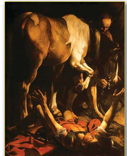
Caravaggio, Conversione di S. Paolo, S. Maria del Popolo.