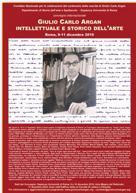
Locandina del Convegno 'Giulio Carlo Argan intellettuale e storico dell'arte' (Sapienza Università di Roma, 9 - 11 dicembre 2010).