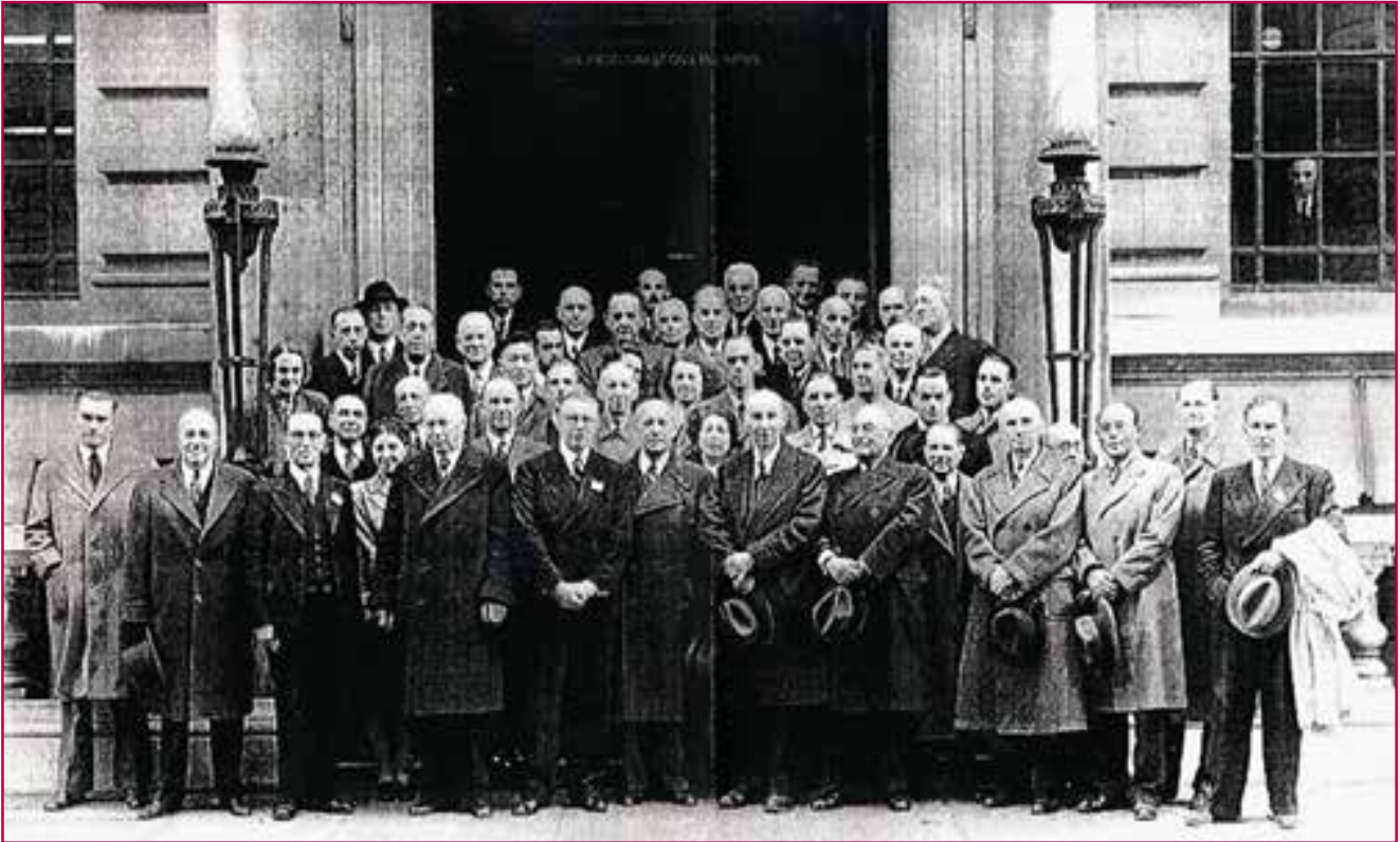
Fig. 2 - Founders of ISO, London 1946.