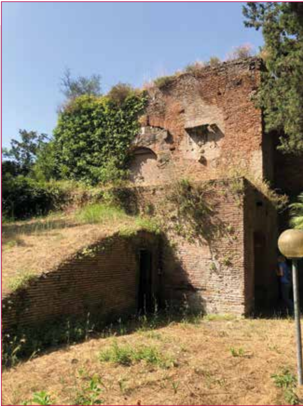
Fig. 4 - Resti della scalinata d'accesso nella parete frontale, luglio 2021.

ca strumentale (Cianci & Colaceci 2017). Tale metodo di rilevamento sarà preceduto da un progetto di ripresa finalizzato alla corretta acquisizione di immagini fotografiche, con l'obiettivo di garantire l'adeguata sovrapposizione delle medesime per ricavare un valido modello numerico per punti (Russo 2020). Il rilievo aerofotogrammetrico del mausoleo tramite SAPR (sistemi aeromobili a pilotaggio