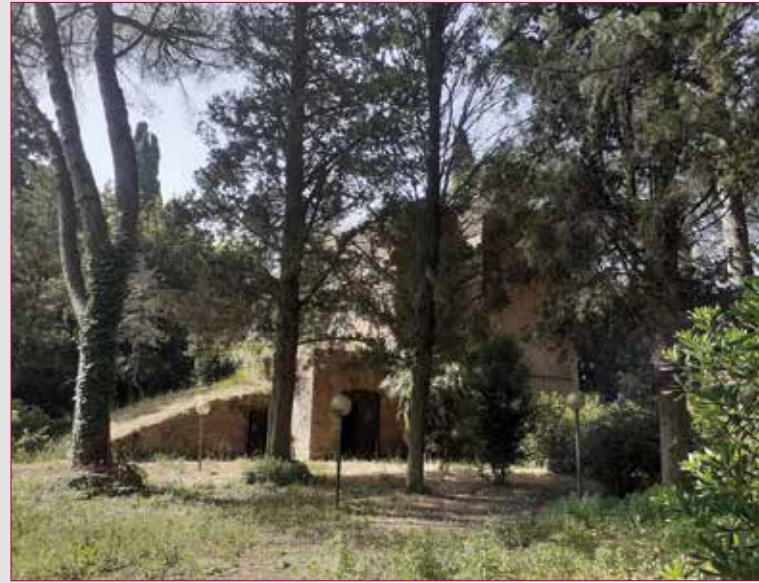
Fig. 3 - Stato di fatto del Mausoleo di Sant'Urbano dopo l'acquisizione da parte del Parco Archeologico dell'Appia Antica e prima degli interventi di ripulitura, luglio 2021.

Il sito presso il quale si trova il Mausoleo di Sant'Urbano è un'area tra la via Appia antica e via dei Lugari. Allo stato attuale, si accede tramite due ingressi posti ognuno su entrambe le vie. Il mausoleo si trova nella parte meridionale dell'area e un breve tracciato con basolato, di cui una porzione ancora visibile, lo congiunge alla Regina Viarum . Alberi, prevalentemente pini, e arbusti punteggiano l'a-