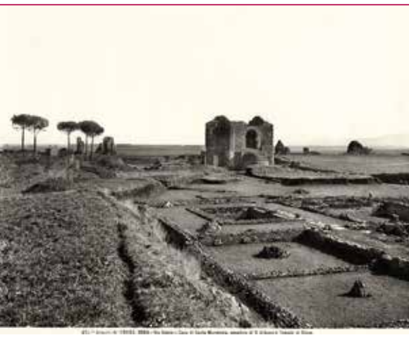
Fig. 2 - Il Mausoleo di Sant'Urbano con la domus Marmeniae in primo piano, 1910.