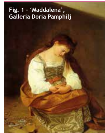
Fig. 1 - 'Maddalena', Galleria Doria Pamphilj

Il martirio di S.Orsola e la Maddalena Doria Pamphilj, espiazione e grazia nell'ultimo itinerario di Caravaggio verso Roma attraverso il messaggio autobiografico, la memoria storica e l'interpretazione dei suoi fautori, artisti, committenti e personalità nel corso del tempo.