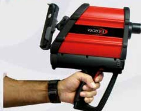
FT-IR "Out of Lab"